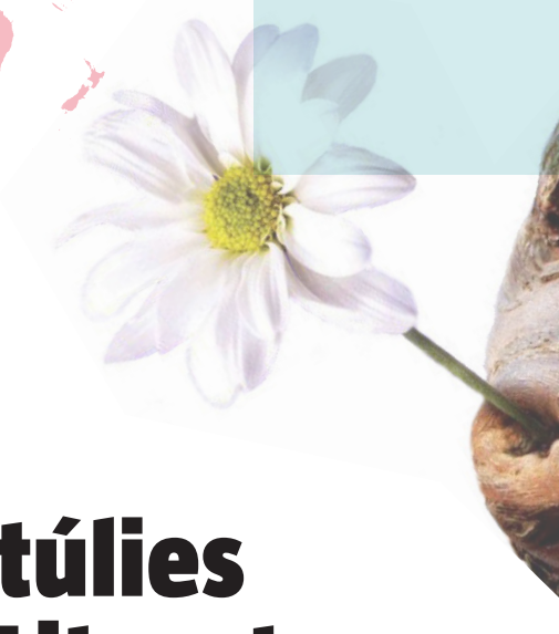
Foto Dragó de Comodo: ©Ifnaki Relanzon / Foto Taula Periòdica dels Elements: ©Alan Aitken, 2014