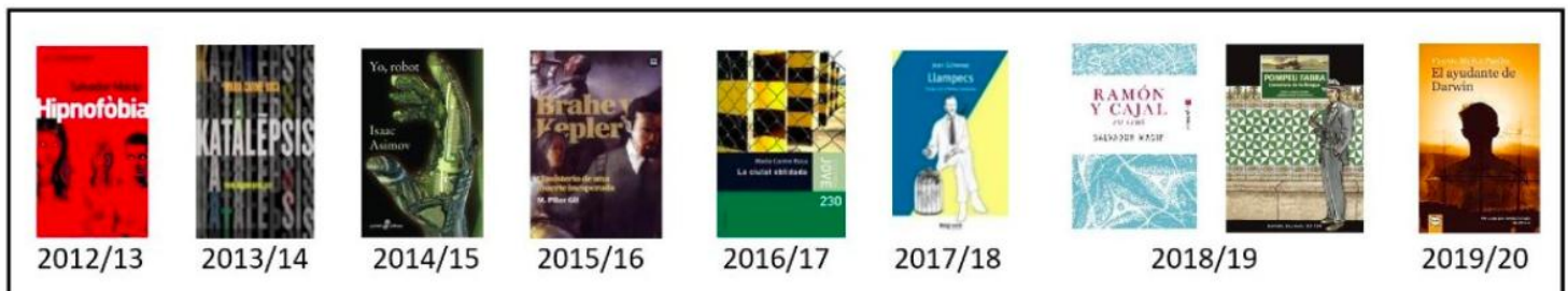
Figura 2: evolució des de l'inici del PLC fins a l'actualitat del Premi Llegim Ciència (PLC) es va començar el curs 2012/13)

En la Figura 2 es mostra l'evolució del PLC al llarg de les vuit edicions, des del 2012/13 fins a l'actualitat: