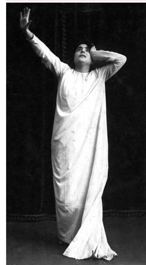
Margarida Xirgu a Andrònica (1910), d'Àngel Guimerà, Teatre Principal, Barcelona.