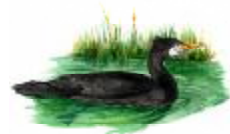
Corb marí gros Phalacrocorax carbo