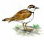
Corriol petit Charadrius dubius