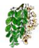
Robínia o acàcia* Robinia pseudoacacia