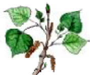
Pollancre Populus nigra