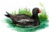
Polla d'aigua Gallinula chloropus