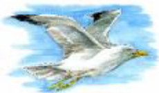
Gavià argentat Larus michaelis

Des d'aquest espai se'n pot observar una gran varietat a simple vista.