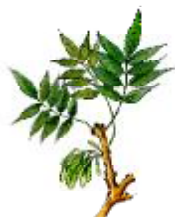
Freixe de fulla gran Fraxinus excelsior