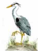
Bernat pescaire Ardea cinerea