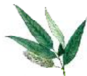
Salze o saule blanc Salix alba