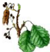
Vern Alnus glutinosa

La vegetació pròpia de les vores del riu s'anomena vegetació de ribera i es caracteritza per formar una sanefa que va resseguint el curs de l'aigua.