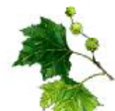
Plàtan* Platanus x hispanica