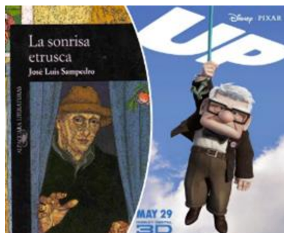
Figura 7. Exemple d'un llibre i una pel·lícula utilitzats per Ariadna Graells a les seves classes d'infermeria per tractar temes de salut des d'una perspectiva social.

L'activitat conclou amb una sessió de reflexió en què les persones participants avaluen el procés de resolució de problemes, expliciten els aprenentatges assolits i consideren com transferir aquestes habilitats a la seva pràctica professional.