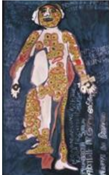
Figura 4. Taller de Mapatge corporal de Harries i Solomon (2018). Els Bambanani. Grup de dones. Ciutat del Cap.

Finalment, durant la tercera sessió les persones participants comparteixen les seves narracions per enriquir els debats i la comprensió col·lectiva. Atès que aquestes narracions reflecteixen un viatge personal de coneixement, marcat per la vulnerabilitat, és essencial oferir un espai respectuós i segur per compartir i participar. Per aquest motiu, abans de començar la sessió cal establir unes regles bàsiques de convivència i respecte mutu.