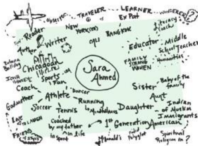
Figura 5. Exemple de Xarxa d'identitat de Sarah K. Ahmed, en el seu llibre Being the Change (2018).

Segons Ahmed (2018), l'eina pot aplicar-se per fases. En primer lloc, es llegeix un text que faci referència directa o indirecta a les identitats d'un personatge. Després d'una introducció teòrica breu, l'alumnat treballa de manera individual, en parelles o en petits grups per construir una xarxa d'identitat d'aquell personatge. En una fase posterior, cada estudiant elabora la seva pròpia Xarxa d'identitat, que es pot compartir amb el grup si així es decideix. Per generar un entorn de confiança, es recomana que la persona facilitadora comenci compartint la seva pròpia xarxa com a model i per trencar el gel.