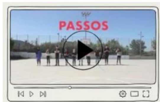
Figura 6. Imatge d'un vídeo de la guia Mirades Polièdriques que mostra l'inici de l'activitat, quan les persones participants es troben a la línia de sortida.

Al final, tot i que totes les persones hagin començat a la mateixa línia, acaben situant-se en punts diferents de la sala, cosa que fa visibles els diversos eixos de discriminació que les travessen. Per aquest motiu, aquesta eina pedagògica s'ha de presentar amb delicadesa i amb la comprensió que l'activitat no s'ha d'interpretar des d'una perspectiva competitiva. En altres paraules, no es tracta de determinar qui va per davant o qui va per darrere, sinó de fer visible que tothom es troba en posicions diferents en funció de múltiples eixos.