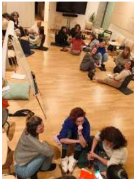
Figura 1. Exemple d'un Cercle de Conversa realitzat en un taller organitzat per Fil a l'Agulla.

assolir objectius en situacions de conflicte, la seva eficàcia es redueix considerablement si el grup no està familiaritzat amb l'eina. Per tant, es recomana fer-ne un ús periòdic. Aquesta pràctica permet que totes les persones involucrades es familiaritzin amb la metodologia, facilita l'adquisició d'habilitats pertinents, millora el coneixement i la connexió entre les persones participants i ajuda a prevenir conflictes.