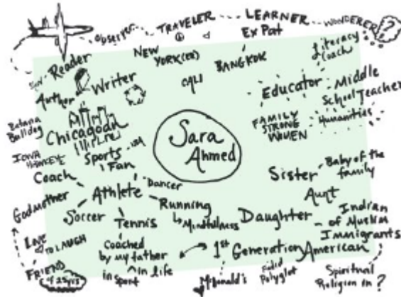
Figure 6. Example of an identity web by Sarah K. Amed, in her book Being the Change (2018).

Identity Webs können auf losem Papier oder in Tagebüchern erstellt werden. Sie können als Eröffnungsaktivität am ersten Tag der Lehre eingesetzt und im Laufe des Jahres immer wieder aufgegriffen werden. Obwohl sie in der Lehre ausgestellt werden können, sind sie nicht als dekorative Tapete gedacht. Stattdessen werden sie zu Dokumenten, die im Laufe des Jahres immer wieder aufgerufen, referenziert und überarbeitet werden, wenn das Lernen voranschreitet.