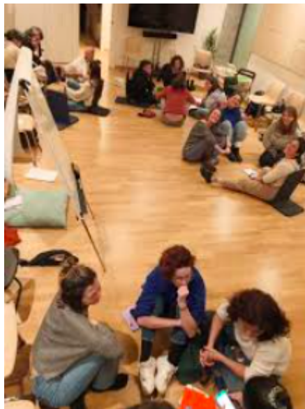
Abbildung 1. Beispiel für einen Talking Circle, der in einem Workshop von Fil a l'Agulla durchgeführt wurde.

Der Talking Circle wird als äußerst effektives Werkzeug zur Konfliktbewältigung innerhalb einer Gruppe angesehen. Gerade in diesen herausfordernden Momenten wird das Potenzial dieser Methodik deutlich. Obwohl sie in solchen Fällen eingesetzt werden kann, um bestimmte Ziele zu erreichen, ist ihre Wirksamkeit erheblich reduziert, wenn die Gruppe mit dem Tool nicht vertraut ist. Daher wird empfohlen, den Circle regelmäßig zu nutzen. Diese Praxis ermöglicht es den Individuen, sich mit der Methodik vertraut zu machen, relevante Fähigkeiten zu erwerben, das Wissen und die Verbindung innerhalb der Gruppe zu stärken und Konflikte zu verhindern.