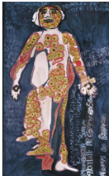
Abbildung 4. Body Mapping Workshop von Harris & Solomon (2018). Die Bambanani. Women's group. Cape Town.

widerspiegeln, die von Verletzlichkeit geprägt ist, muss die Möglichkeit, ihre Erfahrungen mitzuteilen und/oder sich in den Prozess einzubringen, ein demokratischer Akt der Bildung sein (Hooks, 1994). Vor dem Beginn dieser Sitzung müssen Grundregeln festgelegt werden. Ein respektvoller Ort, an dem sie ihre Body Maps und Erzählungen austauschen können, bietet den Studierenden die Möglichkeit, die Bedeutung der vielfältigen Einflüsse auf ihre Persönlichkeit zu verstehen und anzuerkennen, dass jeder eine einzigartige Geschichte hat, die in seiner Body Map zum Ausdruck kommt.