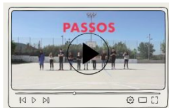
Abbildung 5. Bild eines Videos aus dem Leitfaden Mirades Poliédriques , das den Beginn der Aktivität zeigt, wenn die Teilnehmer an der Startlinie stehen.

Daher muss dieses pädagogische Instrument mit Fingerspitzengefühl und dem Verständnis präsentiert werden, dass diese Aktivität nicht aus einer additiven Perspektive betrachtet werden sollte. Mit anderen Worten, es geht nicht darum, festzustellen, wer weiter vorne oder weiter hinten ist, sondern darum, sichtbar zu machen, dass sich jeder auf mehreren Achsen in unterschiedlichen Positionen befindet. Wären die Fragen unterschiedlich gewesen, hätten sich sicherlich auch die Positionen verändert.