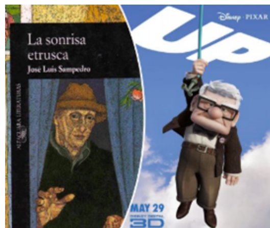
Abbildung 6. Beispiele für ein Buch und einen Film, die Ariadna Graells in ihrem Krankenpflegeunterricht verwendet, um Gesundheitsthemen aus einer sozialen Perspektive zu diskutieren

Die Aktivität endet mit einer Reflexionsrunde, in der die Teilnehmer ihren Problemlösungsprozess bewerten, diskutieren, was sie gelernt haben, und überlegen, wie sie diese Fähigkeiten in ihrer beruflichen Praxis anwenden können.