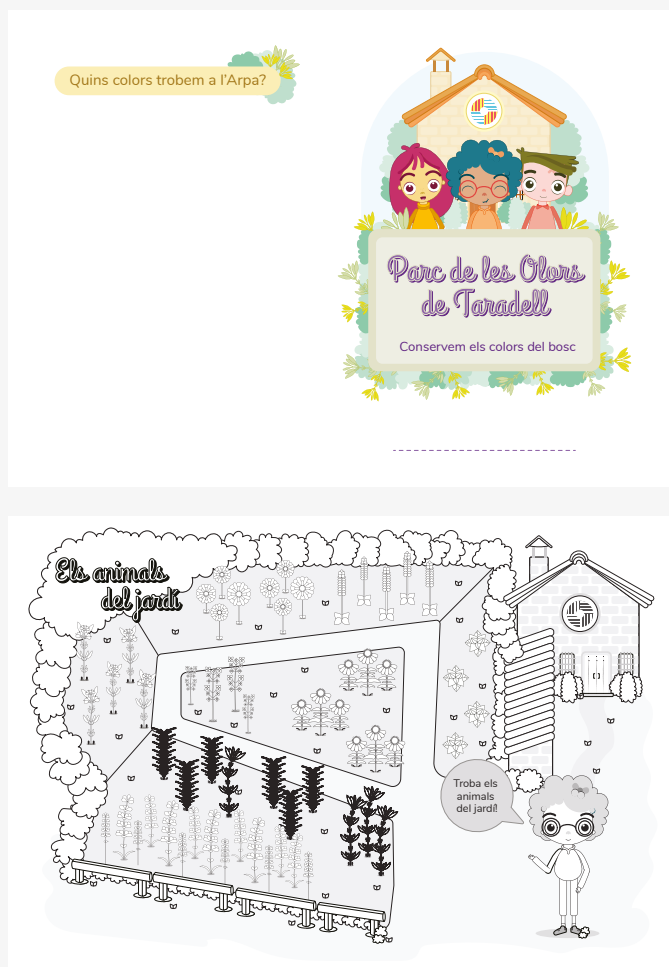
Fig. 2 Mostra del díptic "Conservem els colors del bosc"

Finalment, repartim el díptic "Conservem els colors del bosc", veure fig. 2, a cada infant i els proporcionem els adhesius amb les il·lustracions dels animals, que han d'enganxar a l'interior en l'espai del jardí corresponent. Si disposem de temps també poden pintar el díptic observant els colors que predominen a Can Just.