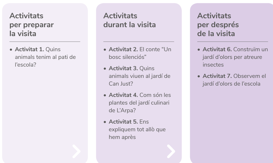
Figura 1. Resum de les activitats en funció del moment en què es porten a terme.