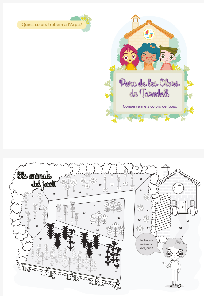
Fig. 2 Mostra del díptic “Conservem els colors del bosc”

Finalment, repartim el díptic “Conservem els colors del bosc”, vegeu figura 2, a cada infant i els proporcionem els adhesius amb les il·lustracions dels animals, que han d'enganxar a l'interior en l'espai del jardí corresponent. En el cas que mostrin dificultats per situar els animals, prioritzarem que sàpiguen identificar en els adhesius els que hem trobat i que siguin capaços de col·locar-los de forma aproximada (per exemple, distingint entre si els hem trobat sobre les plantes o a terra). Si disposem de temps, també poden pintar el díptic observant els colors que predominen a Can Just.