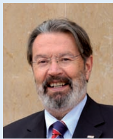
Jordi Montaña i Matosas Rector de la Universitat de Vic - Universitat Central de Catalunya

Després de vint anys de formació universitària ininterrompuda durant els mesos d'estiu, aquest és un bon moment per fer balanç i per observar com l'experiència ens pot ajudar a aproximar-nos al futur amb la mateixa exigència i capacitat d'adaptació a les necessitats de les persones i dels territoris que fins ara.