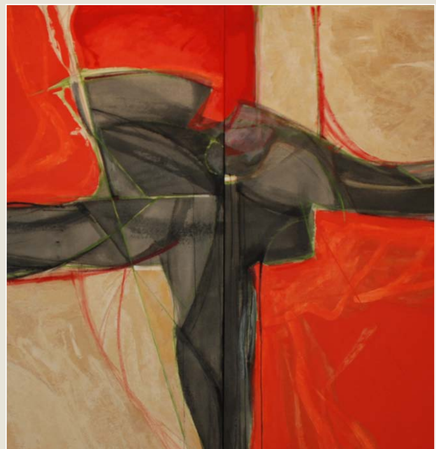
Pintura de Josep Vernis (fragment). Del 31 de juliol al 6 de setembre exposarà una antologia de la seva obra a la sala d'exposicions de Can Puget, a Manlleu, en el marc de l'oferta cultural de la Universitat d'Estiu

33è Festival internacional de música de Catonigròs