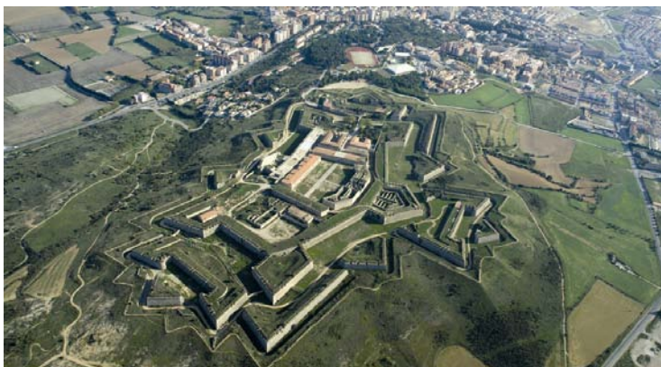
Vista general del Castell de Sant Ferran a Figueres.