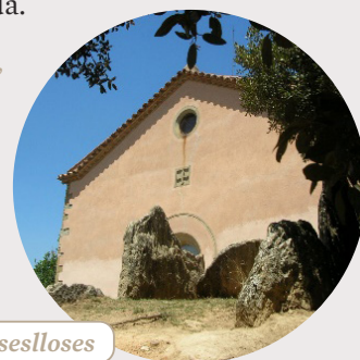
Sant Jordi de Puigseslloses

D'Aires del Montseny, de Jacint Verdaguer (fragment)