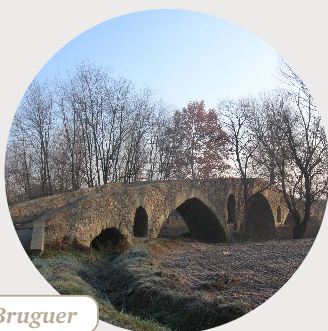
Pont d'en Bruguer

De Pàtria, de Jacint Verdaguer (fragment)